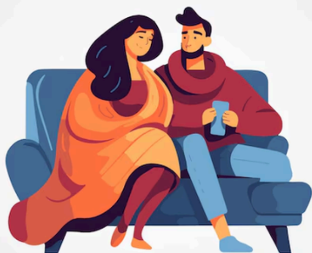
Dovere di Sedersi