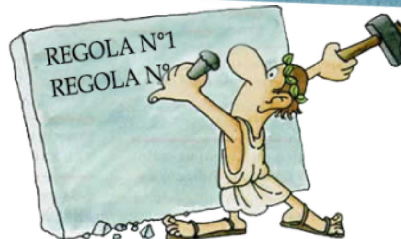
Regola di vita