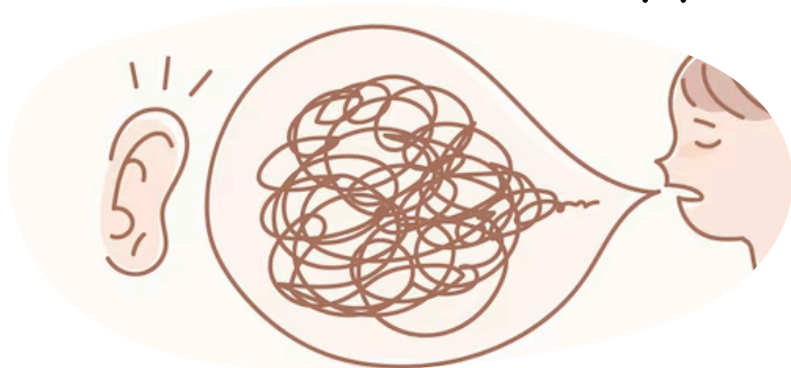
Ascolto della Parola

Nel DDS, tutte le coppie sono invitate a prepararsi sullo stesso punto