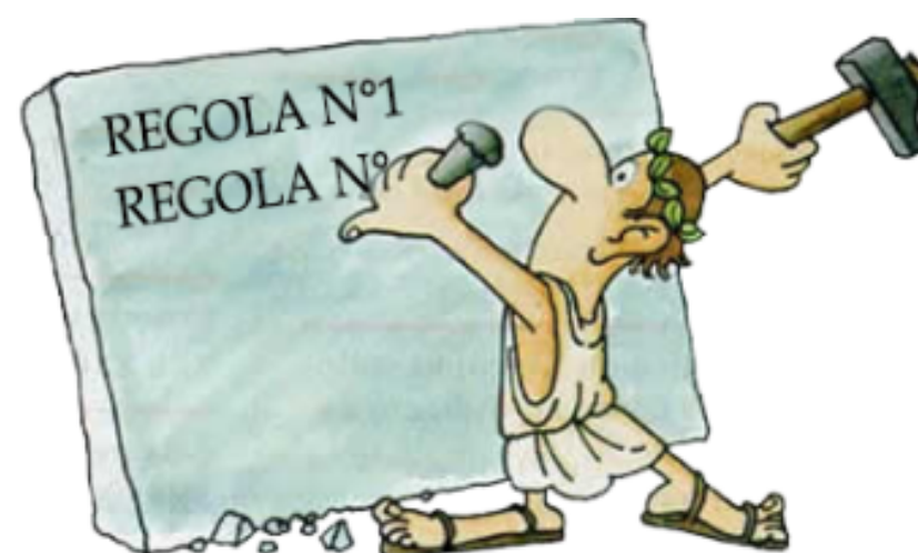
Regola di vita