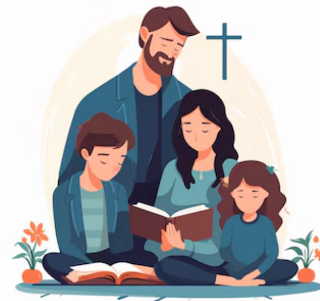
Preghiera coniugale e familiare